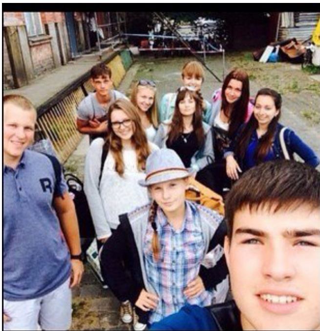
Фото Н.Самодельной, Германия, 2014.