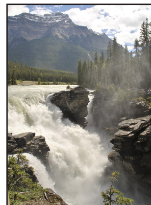
На фото: Бабушка на митинге в Канаде («Raging GRANNIES say NO!»); природа Канады.